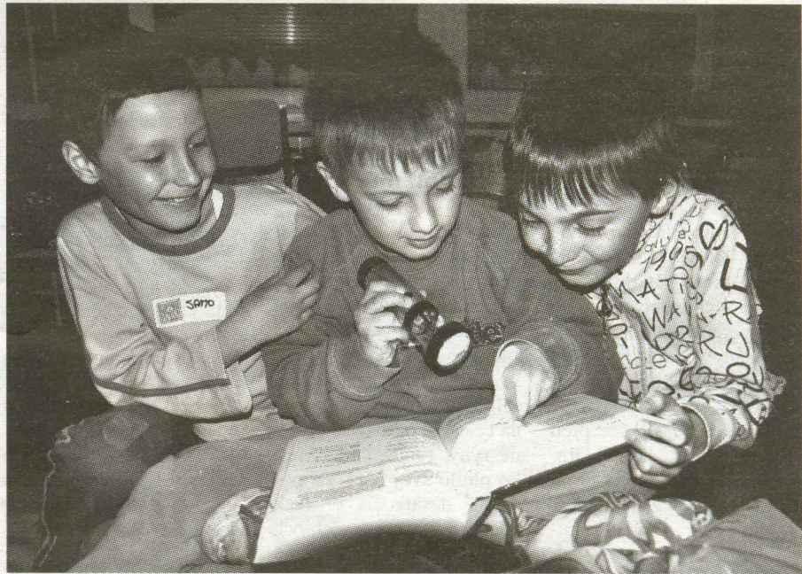
Hlavnou myšlienkou Noci s Andersonom je prilákať deti ku knihám.

Deti boli rozdelené do troch skupín. Každá musela prejsť tromi komnatami, kde na nich čakalo 13 úloh. Jazykolamy, hádanky, tajničky, ďalšie logické ale aj pohybové úlohy. Na nočnej výprave si išli na obecný úrad vyzdvihnúť sladkú odmenu v podobe dvoch tórt od starostu. Využili aj mož-